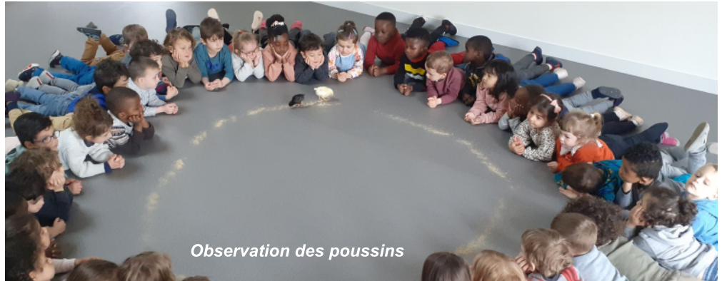
Observation des poussins

Des travaux sont prévus durant l'été dans les locaux de l'école : le revêtement du sol du hall va être changé et les sanitaires des garçons totalement rénovés.