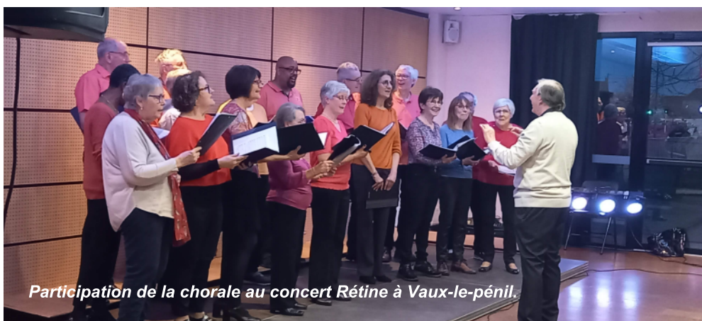
Participation de la chorale au concert Rétine à Vaux-le-pénil.