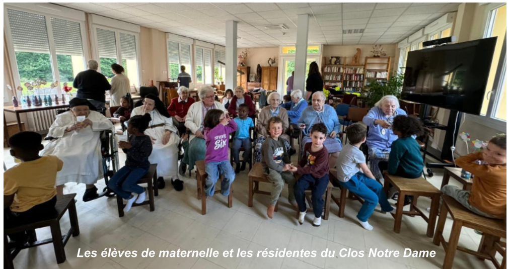
Les élèves de maternelle et les résidentes du Clos Notre Dame