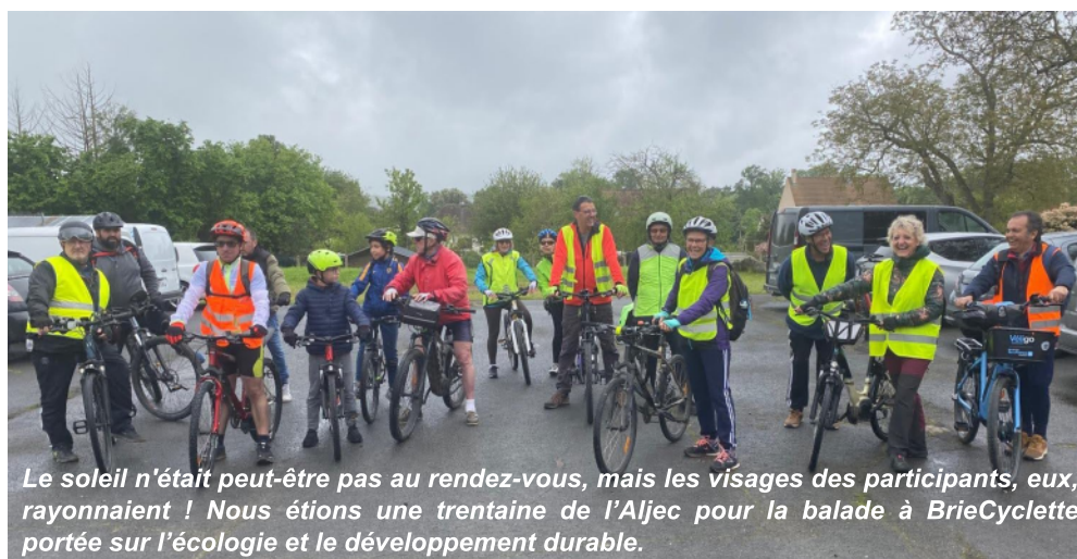
Le soleil n'était peut-être pas au rendez-vous, mais les visages des participants, eux, rayonnaient ! Nous étions une trentaine de l'Aljec pour la balade à BrieCyclette portée sur l'écologie et le développement durable.