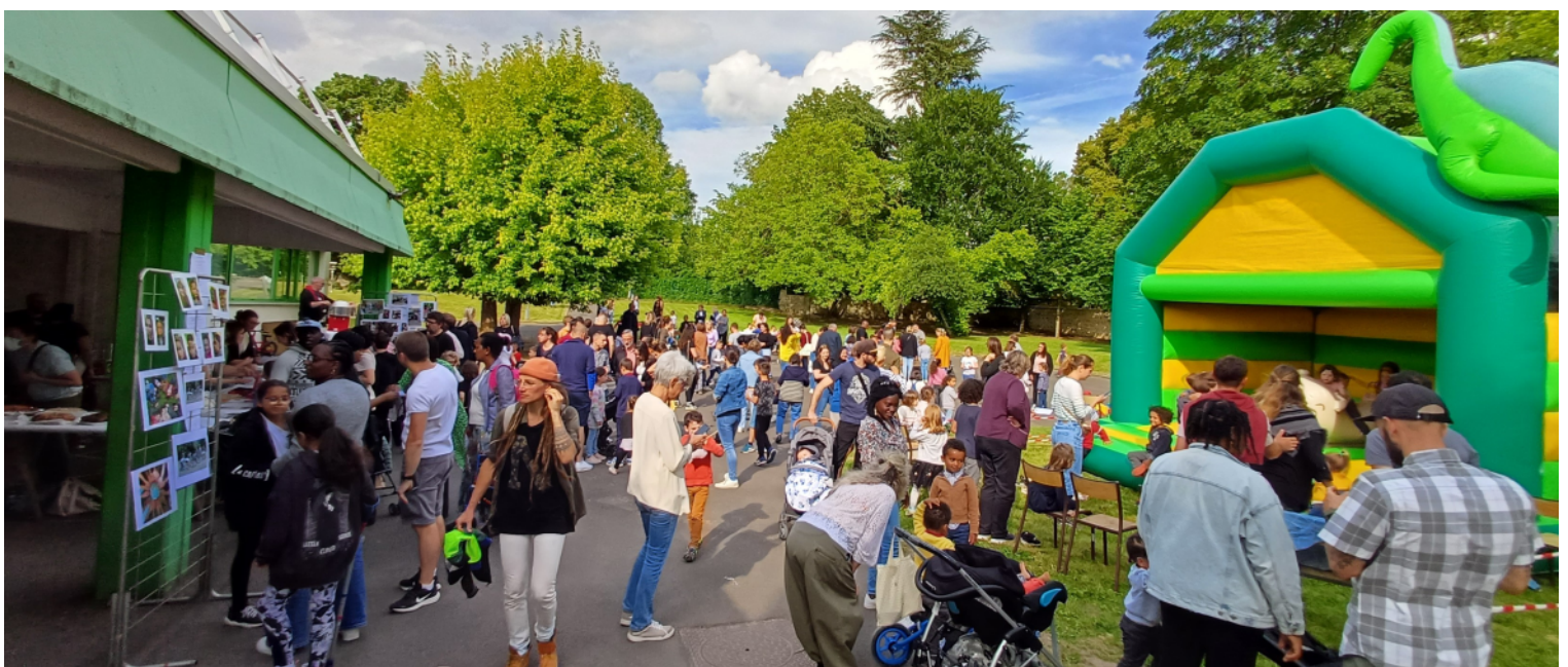
La kermesse des écoles organisée par l'APILS et les enseignants fut un grand succès. Jeux, tombola, et l'occasion aussi de découvrir des activités proposées par les services périscolaires.